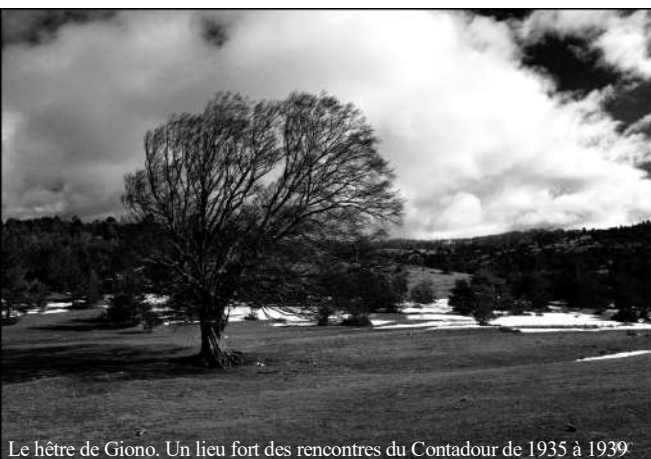
Le hêtre de Giono. Un lieu fort des rencontres du Contadour de 1935 à 1939

Les photos qui illustrent ce bout d'article ont été prises début janvier, alors qu'un vent déchaîné n'en finissait pas de tordre les nuages... à l'occasion d'un reportage photographique destiné à illustrer un article plus étoffé de Claude Agnel, qui paraîtra dans le prochain numéro du « Pays d'Apt ».