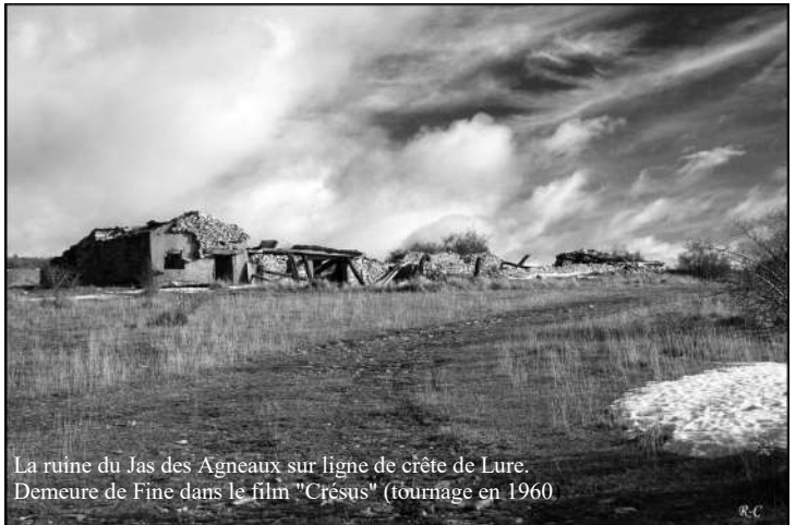
La ruine du Jas des Agneaux sur ligne de crête de Lure. Demeure de Fine dans le film "Crésus" (tournage en 1960)

Alors, si vous vous voulez vous dépayser un peu sans parcourir beaucoup de kilomètres, allez faire un tour, de préférence pendant ce que certains appellent à tort « la mauvaise saison », du côté de Redortiers, du Contadour, des Franches et de leurs bergeries en ruine, du côté de Saumane, de l'Hospitalet, de Saint-Etienne-les-Orgues ou de Notre-Dame-de-Lure, en vous laissant habiter par le caractère tragique de la montagne et par vos propres fantasmes. Marchez sur la ligne des crêtes en longeant les à-pic qui dominent la vallée du Jabron et qui vous offrent en prime le spectacle des Alpes enneigées, et une vérité vous sautera aux yeux, celle de Giono s'adressant aux comédiens du film