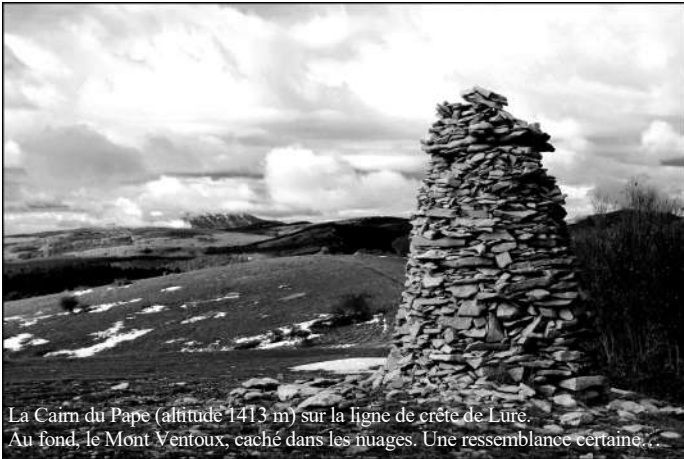
La Cairn du Pape (altitude 1413 m) sur la ligne de crête de Lure. Au fond, le Mont Ventoux, caché dans les nuages. Une ressemblance certaine...