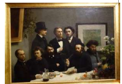
« le coin de table »

Cette soirée inhabituelle a entièrement satisfait les assistantts